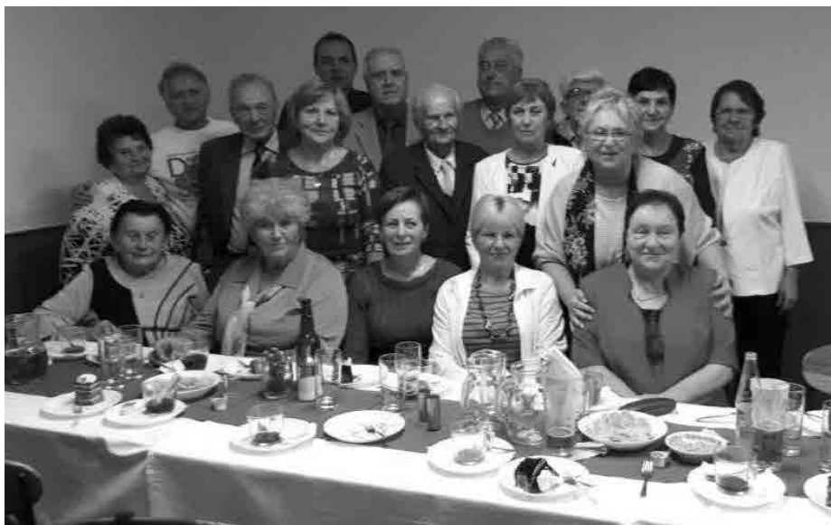
Setkání s jubilanty