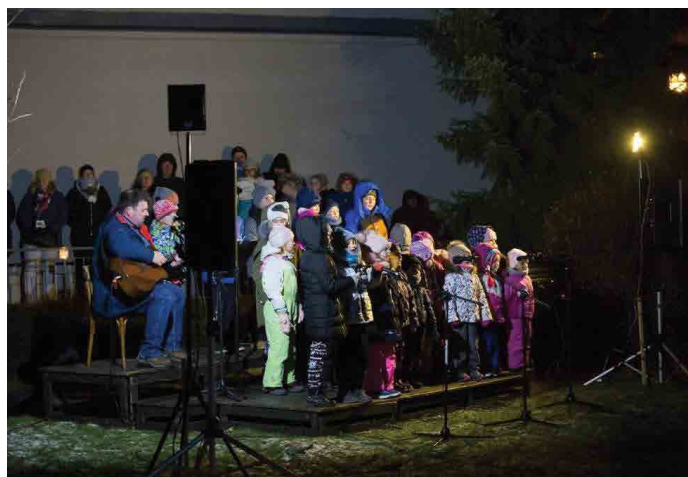
Rozsvícení vánočního stromu